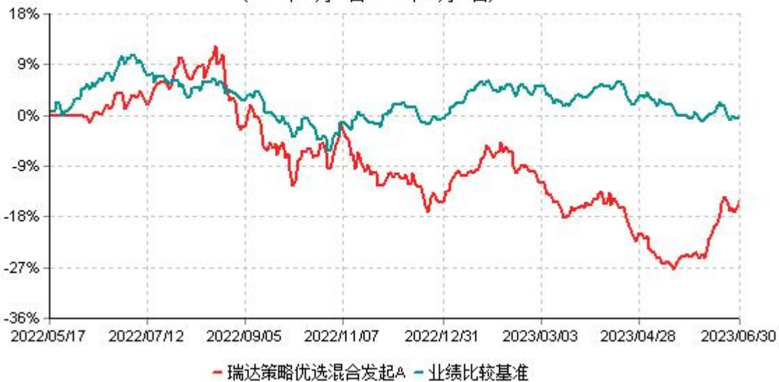
瑞达策略优选混合发起A累计净值增长率与业绩比较基准收益率历史走势对比图 (2022年05月17日-2023年06月30日)